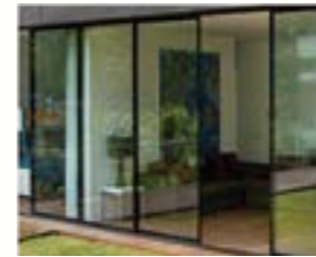
GLASS / VIDRO